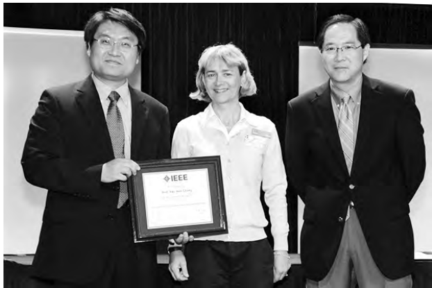
■張耀文2013年於頂尖國際會議第50屆DAC獲頒四項研究貢獻獎（過去十年發表34篇DAC論文，全球第一名等四項紀錄創新獎）。

談到教學理念時，他說：「學校教育應該培養學生獨立和解決問題的能力，並要讓他們能夠把所學和生活